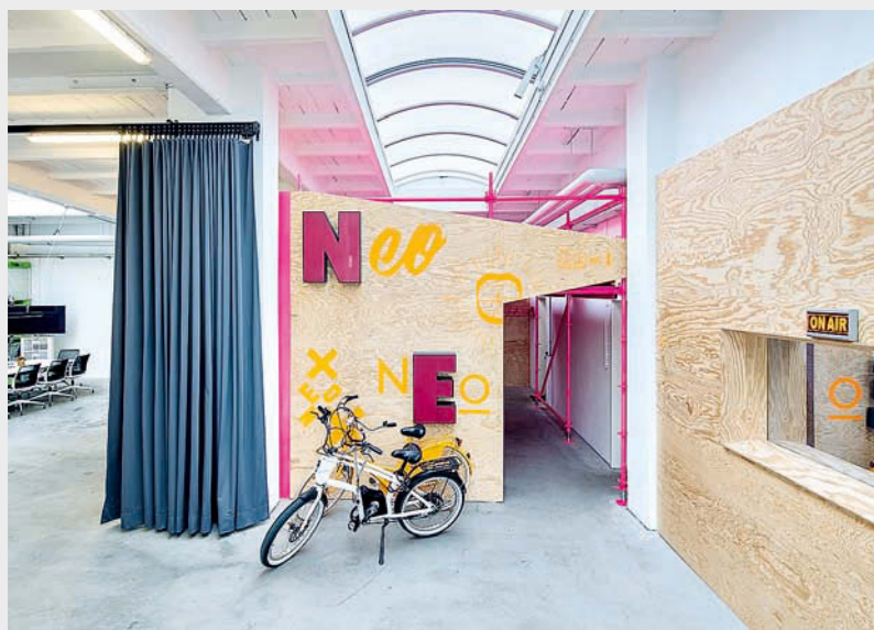
Unkonventionell: der Festival-Bereich mit Dach-Lounge • Unconventional: the festival area with roof lounge

konnten: Welche Räumlichkeiten wir wirklich benötigen, welche Möbel unserer Arbeitsweise gerecht werden, welche Prozesse unseren Alltag bestimmen, welche technische Ausstattung wirklich nötig ist und welche Gegebenheiten ideal für eine gute und kreative Zusammenarbeit innerhalb der Teams, der ganzen Agentur und vor allem mit unseren Kunden sind. Allem voran gelernt haben wir, dass ein Neuanfang nicht nur Mut braucht, sondern dass es extrem wichtig ist, sich von alten Denkmustern zu befreien. Loslassen heißt die Devise. Dabei war es schön zu beobachten, wie diese Radikalität auch unsere Mitarbeiter angesteckt hat. Allerdings war uns auch bewusst, dass jene unglaubliche Energie, die anfangs freigesetzt wurde, nicht ewig halten wird. Deswegen war es erforderlich, schlussendlich wieder in eine feste Heimat zu ziehen. Daher sind wir seit August 2018 im Ludwigsburger Berardi Areal zu finden. Alles, was hier entstand, ist das unmittelbare Ergebnis unseres eigenen Transformationsprozesses. So zeichnet sich unser neo.Office in erster Linie durch vollkommene Demokratie aus. Geprägt ist unser Konzept von Transparenz, flachen Hierarchien und einer starken Mitbestimmung der Mitarbeiter. Bei der Planung haben wir viele ihrer Anregungen und Bedürfnisse berücksichtigen und Wünsche umsetzen können - wie etwa, dass uns unser Koch auch in den neuen Räumlichkeiten zur Verfügung steht. Er sorgt täglich für frisches Essen - Bio-Obst und Wasser sind gratis.