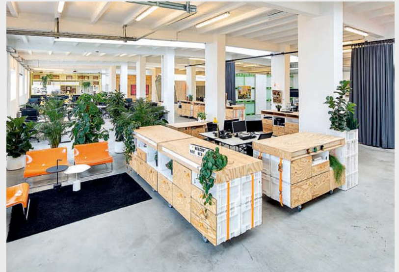
... beeinflusste die neue Gestaltung des neo.Offices. • ... influenced the new design of the neo.Office.

Marmor, Chrom und Glas sowie eine mehr oder weniger zeitgemäße Architektur - geprägt von kleinen Büros, in denen klassisch gearbeitet wurde, Meetingräumen hinter dicken Wänden und Empfangsbereichen mit repräsentativer Ausstattung. Stärker konnten die Kontraste nicht sein. So zogen wir innerhalb von drei Monaten um, installierten unser Pop-up-Office und wagten den Neuanfang: Wir wollten Werkstatt-Atmosphäre erleben - mit Start-up-Spirit und dem weißen Blatt Papier, das in unserem Fall die Eingangshalle eines seit drei Jahren leer stehenden Gebäudes bietet.